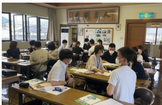
▲ユースカレッジ グループ授業