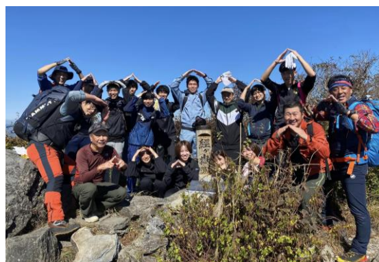
▲ユースカレッジ 平谷登山