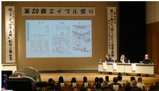
▲エイブル祭りオープニングセレモニー パネルディスカッション