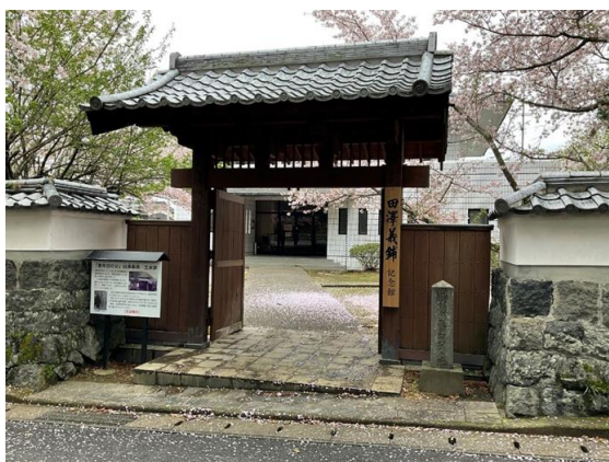
▲田澤義鋪記念館 正面玄関